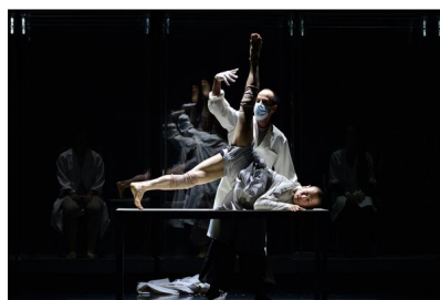
„Genesis“ von Sidi Larbi Cherkaoui und Yabin Wang auf Kampnagel Hamburg