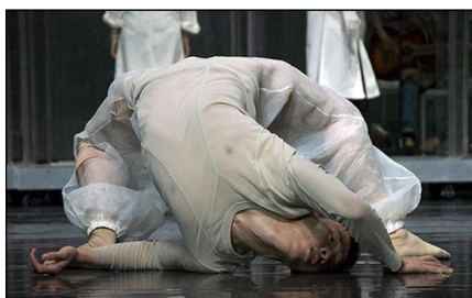
„Genesis“ von Sidi Larbi Cherkaoui und Yabin Wang auf Kampnagel Hamburg